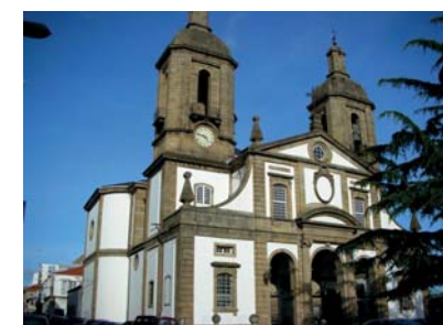
5 St. Julian Con-Cathedral St. Julian Con-Kathedrale St. Julian Con-cathédrale