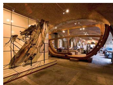
3 Exponav Museum Exponav Museum Musée Exponav