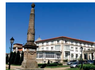
6 Churruca Obelisk Churruca Obelisk Churruca Obélisque