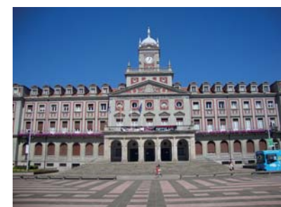
4 Town Hall Rathaus Mairie