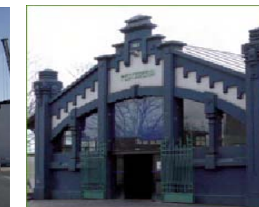
8 Fish Market Fishmarkt Marché aux poissons