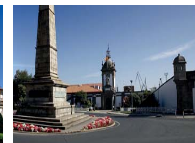
7 Military Arsenal Door Militärarsenal Tür Porte Arsenal Militaire